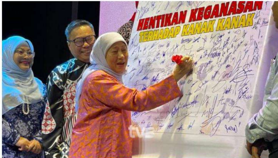
Dato Sri Nancy Shukri merasmikan Program Advokasi Perlindungan Kanak-Kanak: Kasih Kanak-Kanak bersama Kelab Pembimbing Rakan Sebaya di Kuching pada Sabtu.