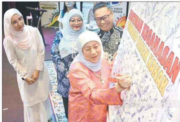
Nancy signs a banner at the event, as a show of support for the campaign on ending violence against children.

In this respect, Nancy said the advocacy programme meant to