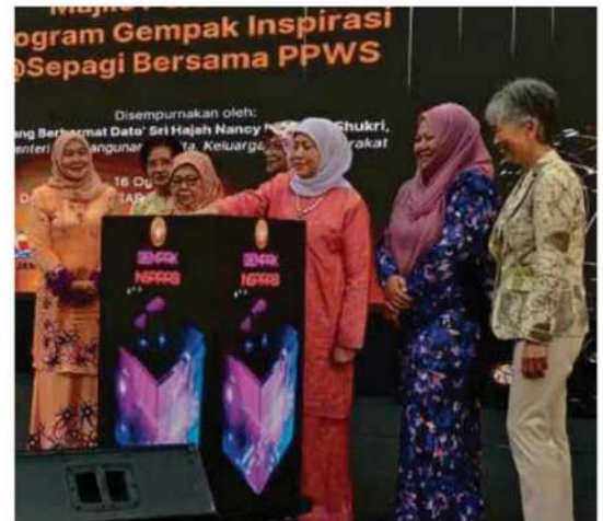
Nancy merasmikan Program Gempak Inspirasi @Sepagi Bersama Persekutuan Perkumpulan Wanita Sarawak di Kuching, semalam.

Beliau turut menegaskan kepentingan semua pihak, termasuk ibu bapa, institusi pendidikan dan masyarakat untuk memainkan peranan dalam membendung isu buli daripada terus berleluasa.