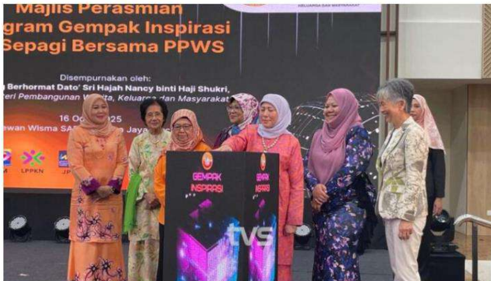
Datuk Seri Nancy Shukri merasmikan Program Gempak Inspirasi @ Sepagi Bersama PPWS di Wisma SABATI, Kuching pada Sabtu.