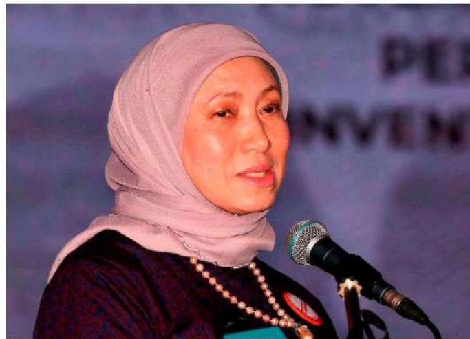
Minister for Women, Family and Community Development Datuk Nancy Shukri

KUCHING: Report your seniors, wardens and teachers to the highest level, if found to be involved in bullying, said Federal Minister for Women, Family and Community Development Datuk Nancy Shukri today.