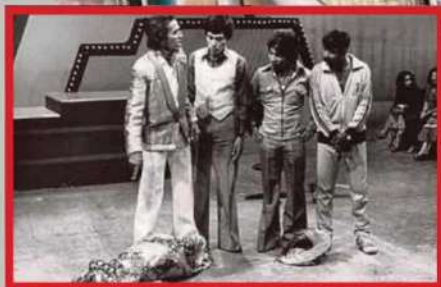
MAT Sentul (diri) pada zaman kegemilangannya. Gambar tahun 1979.

luarga dan tinggal bera- sangan dengan sumba- ngan RM500 sebulan bagi menampung keperluan