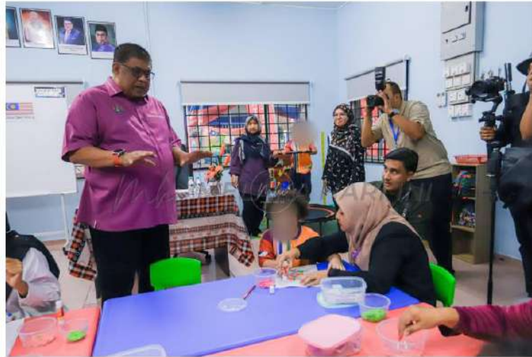
AB Rauf menyantuni anak-anak istimewa di Tabika Tunas Istimewa, Ayer Hitam Pantai, Tanjung Bidara.