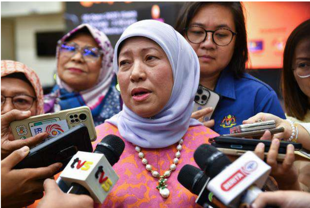
Datuk Seri Nancy Shukri, menegaskan kuasa menggubal undang-undang bukan di bawah bidang kuasa kementeriannya.

Nasional - Dicipta: 16 Ogos 2025 06:30 PM