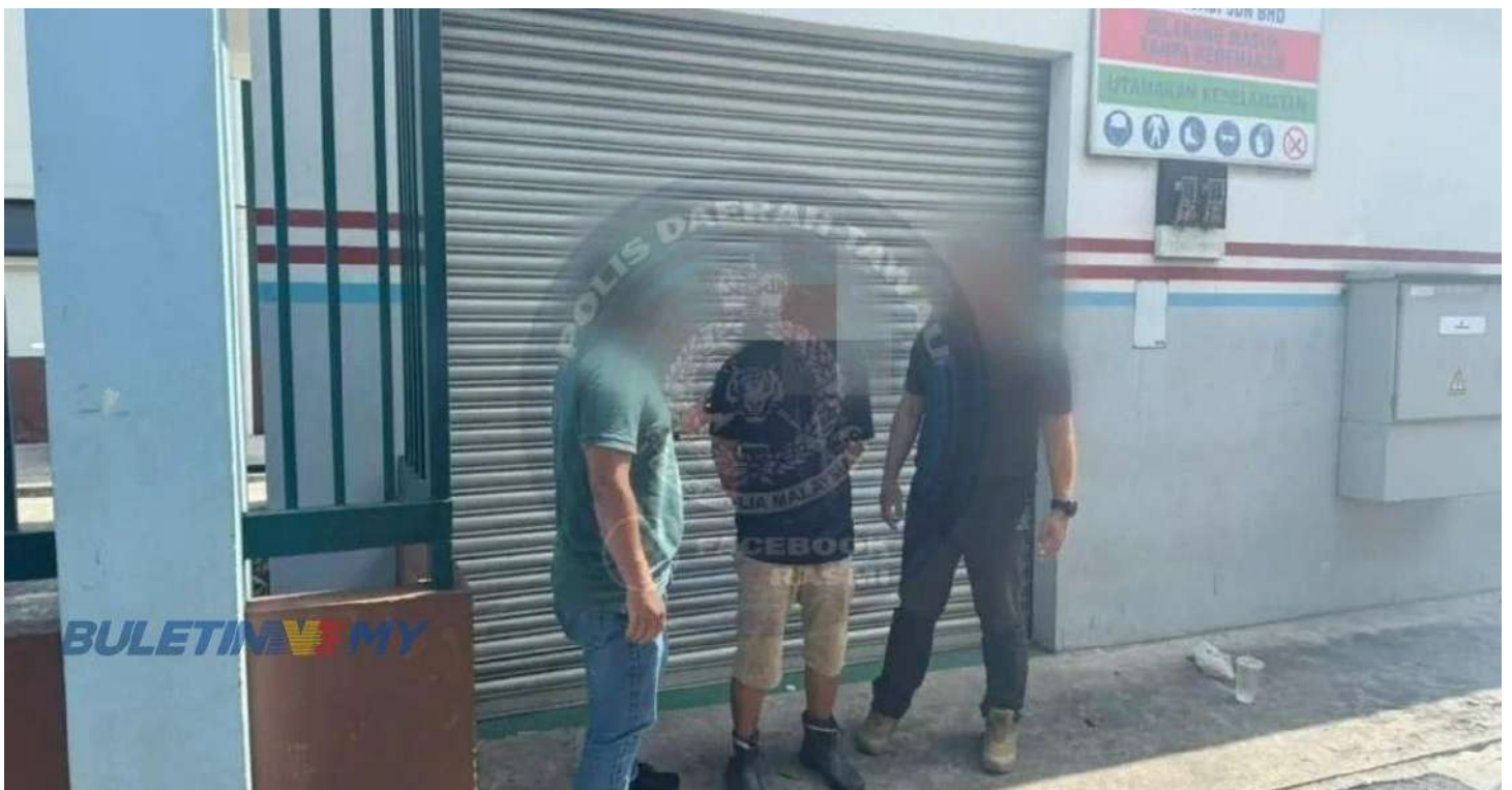
Suspek (tengah) ketika ditahan polis semalam.

TAWAU: Seorang lelaki tergamak menumbuk isterinya hanya kerana wanita itu lambat membuka pintu bilik sewa di Jalan Dunlop, di sini, kelmarin.