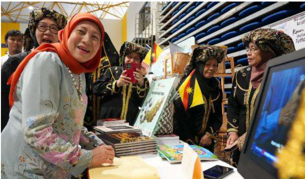
Datuk Seri Nancy Shukri ketika ditemui di Wacana Khas Keluarga Islam Sarawak 2025 di Dewan Suarah Miri

Nasional - Dicipta: 17 Ogos 2025 10:29 PM