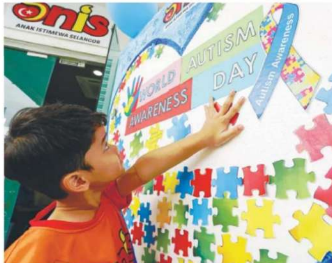
Yahya said early intervention and structured learning environments for children with autism could transform lives.

specialised training in autism spectrum disorder, sensory integration, behaviour management and assistive communication tools, supported by regular professional development and classroom aides.