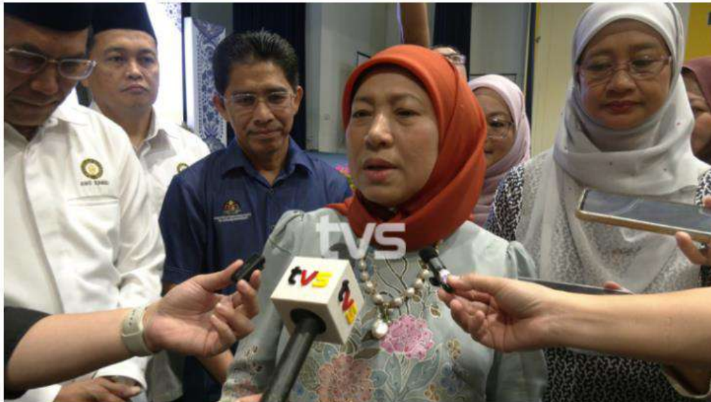
Datuk Seri Nancy Shukri ketika ditemui selepas Program Wacana Khas Keluarga Islam Sarawak 2025 'Syariah Asas Keluarga Sejahtera' di Miri hari ini.