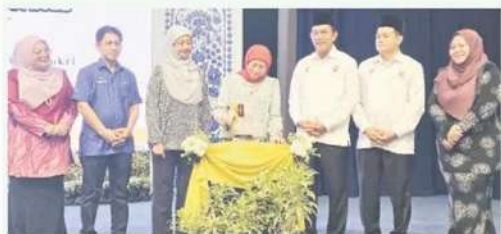
RASMI: Nancy merasmikan Unit Pemantauan, Bahagian Sokongan Keluarga semasa Wacana Khas Keluarga Islam Sarawak 2025 di Dewan Suarah Miri semalam.

MIRI: Menteri Pembangunan Wanita, Keluarga dan Masyarakat Dato Sri Nancy Shukri mahu ramai wanita khususnya ibu tunggal dibantu untuk menuntut nafkah anak daripada bekas suami melalui mahkamah. Menurut Nancy, walaupun telah menerima surat penghakiman daripada mahkamah, namun masih ada di kalangan bekas suami atau bapa yang ingkar terhadap perintah tersebut.