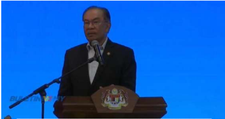
Anwar ketika berucap pada Perjumpaan Bulanan Warga Jabatan Perdana Menteri (JPM) di Putrajaya, hari ini.