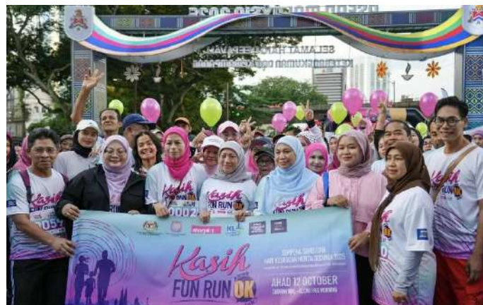
Nancy Shukri bersama orang ramai memeriahkan kempen 'Awak OK Tak? Jom Kongsi' sempena program Kasih Fun Run di Dataran DBKL, semalam.

Menteri Nancy Shukri berkata panggilan itu diterima menerusi Talian Kasih, iaitu talian utama kempen untuk membantu masalah tekanan dalam kehidupan.