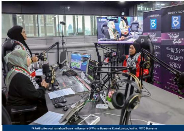
FARAH ketika sesi temu bual bersama Bernama di Wisma Bernama, Kuala Lumpur, hari ini.

Kuala Lumpur: Pembabitn wanita dalam misi kemanusiaan bukan sekadar pelengkap, sebaliknya memainkan peranan strategik khususnya di zon konflik yang membabitkan golongan paling terkesan seperti kanak-kanak dan ibu tunggal.