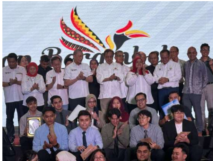
Program tahunan Lan Berambah Anak Sarawak (LBAS) kembali tahun ini dengan skala penganjuran yang lebih besar dan berimpak tinggi.