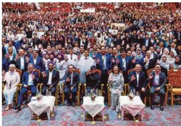
Minister in the Prime Minister's Department (Law and Institutional Reform) Datuk Seri Azalina Othman Said (front row, fourth from right) with participants at the International Young Future Leaders Summit (iFuture) in Kuala Lumpur yesterday.

KUALA LUMPUR: The proposed Anti-Bullying Tribunal law being drafted by the government will not replace the Penal Code, but instead complement it by addressing acts of bullying that fall outside the scope of criminal offences.