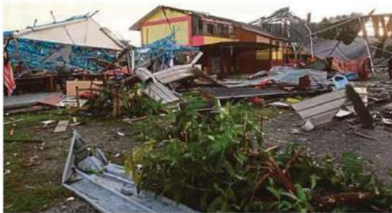
SK Kampung Medan, Teluk Panglima Garang rosak teruk akibat ribut, kelmarin.

Fadhlina turut mendoakan agar seluruh warga sekolah diberikan keselamatan dalam menghadapi ujian berkenaan.