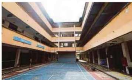
Parents play a big role in making school reforms a success.

She added that they would collaborate with the relevant ministries, as well as with parent-teacher associations, parent-community associations, and non-governmental organisations to address challenges.