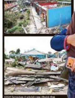
RISAK bangunan di sekolah yang dibina di...

'Cucu saya mengigau, menangis' “Ribut ini merusaki lebih 40 rumah dan merusakan lima sekolah, termasuk Sekolah Kebangsaan (SK) Sijanggang Jaya, SK Kampung Medan, SK Jalan Tinggi, Dewan Harmoni Baru 7 dan dewan,” katanya. Menurut beliau, semua rumah yang rusak dan dewan merusaki akibat ribut dan puting belang merusaki kawasan ini. “Semua ini merusaki lebih 40 rumah dan merusakan lima sekolah, termasuk Sekolah Kebangsaan (SK) Sijanggang Jaya, SK Kampung Medan, SK Jalan Tinggi, Dewan Harmoni Baru 7 dan dewan,” katanya. Menurut beliau, semua rumah yang rusak dan dewan merusaki akibat ribut dan puting belang merusaki kawasan ini.