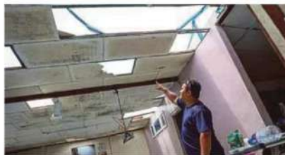
Bumbung sebuah rumah terjejas akibat ribut di Kuala Langat, semalam.

"Mujurlah kami sempat berindung di bawah meja daripada ditimpa dinding yang runtuh," katanya.