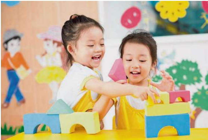
PUSAT asuhan kanak-kanak wajar diperkasa dengan sistem pemantauan lebih ketat agar keselamatan dan kebajikan kanak-kanak sentiasa terjamin. -GAMBAR HIASAN

Oleh Rencana Utusan 16 Oktober 2025, 9:00 am