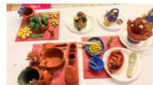
Salah satu terapi yang digunakan dalam sesi terapi minda

"Di samping itu, ia juga dapat menghargai kerjaya kaunselor yang sentiasa menyediakan perkhidmatan bimbingan dan khidmat sokongan yang berkesan kepada komuniti," katanya ketika merasmikan program tersebut di Mydin Parit Bunter di sini, hari ini.