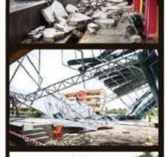
LEBIH 40 RUMAH LIMA SEKOLAH ROSAK TERUK