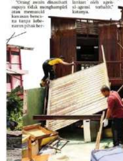
JKR sedang melakukan pemeriksaan keselamatan bangunan.