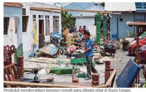
Penduduk membersihkan kawasan rumah yang dibadai ribut di Kuala Langat, kelmarin.