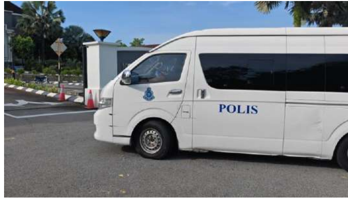
DUA pelajar lelaki berusia 17 tahun tiba di Mahkamah Alor Gajah menaiki kenderaan polis bagi menghadapi pertuduhan kes rogol berkumpulan pelajar junior.