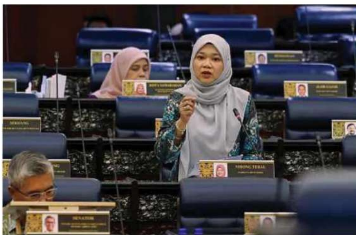
FADHLINA ketika sesi pertanyaan bagi jawab lisan di Dewan Rakyat, semalam.

"Pemantauan dan penilaian pelaksanaan terhadap semua inisiatif yang dilaksanakan pihak sekolah akan dinilai semula setiap 15 hari. Menteri dan Timbalan Menteri serta penguurusan tertinggi KPM akan terus bertemu dengan war-