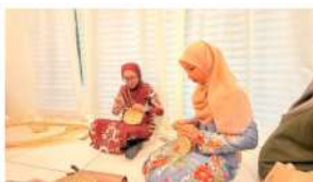
Antara pengisian program membuat bakul salah satu terapi kepada pesakit mental

PARIT BUNTAR, 16 Okt (MalaysiaAktif) – Kementerian Pembangunan Wanita, Keluarga dan Masyarakat (KPWKM) telah menetapkan Oktober sebagai Bulan Kaunseling Kebangsaan (BKK).