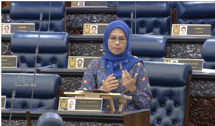
Timbalan Menteri Pembangunan Wanita, Keluarga dan Masyarakat, Datuk Seri Dr. Noraini Ahmad.

Nasional - Dicipta: 16 Oktober 2025 04:06 PM