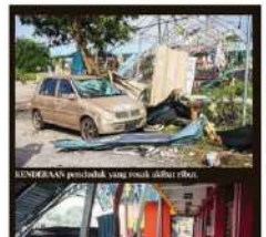
KERUSAKAN peribadi yang rusak akibat ribut.

Kerja baik pulih empat sekolah disergerakkan Putrajaya: Kerja pembaikan dan pentadbiran kewangan diwujudkan di empat sekolah yang terjejas akibat kejadian ribut di Telok Panglima Garang, Selangor petang kelmarin. Menurut Kementerian Pendidikan (KEM), empat sekolah itu ialah Sekolah Kebangsaan Kebangsaan (SK) Sijanggang Jaya, Sekolah Kebangsaan (SK) Sijanggang Jaya, SK Kampung Medan dan SK Jalan Tinggi. Menurut KEM, empat sekolah ini telah menerima bantuan kewangan dan pembaikan di rumah (PDR) dalam tempoh terdekat bagi membolehkan proses pembelajaran dapat diteruskan serta memastikan keselamatan dan kesejahteraan murid, guru dan seluruh warga sekolah, mematuinya. KEM turut menerima jabatan pendidikan negeri, pejabat pendidikan daerah dan pentadbir sekolah di sekolah-sekolah untuk meningkatkan kerjasama dalam membaharui cuaca tidak menentu pada ketika ini, bagi memastikan keselamatan dan kesejahteraan seluruh warga pendidikan terpelihar.