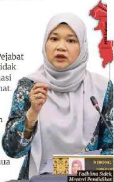
FADHLINA SIDEK , Menteri Pendidikan

Banyak kes salah laku di sekolah 'tersangkut' di peringkat Jabatan Pendidikan Negeri (JPN), Pejabat Pendidikan Daerah (PPD) kerana dianggap isu tidak serius. Serentak itu, KPM melaksanakan reformasi serta-merta untuk pastikan sekolah lebih selamat. Antaranya tumpuan kepada aspek kesihatan mental pelajar dan larangan keras bahan terlarang ke sekolah. Mata pelajaran Pendidikan Karakter pula akan dimulakan tahun depan oleh prasekolah bermatlamat memperkasa pembangunan peribadi sahaja murid. Semua JPN, PPD dikerah gerakan reformasi itu di semua 10,243 sekolah seluruh negara.