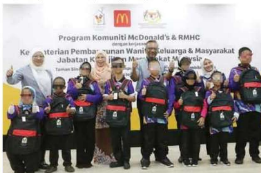
ANTARA kanak-kanak yang diraikan sempena Program Bulan Komuniti McDonald's dan RMHC 2025.