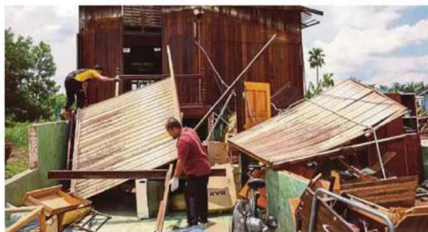
Penduduk membersihkan rumah yang terjejas akibat ribut di Teluk Panglima, semalam.

Sementara itu Penyelaras DUN Sijangkang, Datuk Zurihan Yusop cemas selepas bangunan Pejabat Penyelaras DUN itu di Dewan Wawasan Kampung Medan, di sini, runtuh dalam kejadian ribut petang kelmarin.