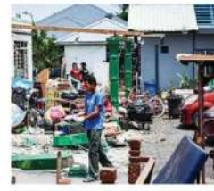
17 mangsa ditempatkan di PPS Dewan Harmoni Baru 7

Kerja baik pulih empat sekolah disergerakkan Putrajaya: Kerja pembaikan dan pentadbiran kewangan diwujudkan di empat sekolah yang terjejas akibat kejadian ribut di Telok Panglima Garang, Selangor petang kelmarin. Menurut Kementerian Pendidikan (KEM), empat sekolah itu ialah Sekolah Kebangsaan Kebangsaan (SK) Sijanggang Jaya, Sekolah Kebangsaan (SK) Sijanggang Jaya, SK Kampung Medan dan SK Jalan Tinggi. Menurut KEM, empat sekolah ini telah menerima bantuan kewangan dan pembaikan di rumah (PDR) dalam tempoh terdekat bagi membolehkan proses pembelajaran dapat diteruskan serta memastikan keselamatan dan kesejahteraan murid, guru dan seluruh warga sekolah, mematuinya. KEM turut menerima jabatan pendidikan negeri, pejabat pendidikan daerah dan pentadbir sekolah di sekolah-sekolah untuk meningkatkan kerjasama dalam membaharui cuaca tidak menentu pada ketika ini, bagi memastikan keselamatan dan kesejahteraan seluruh warga pendidikan terpelihar.