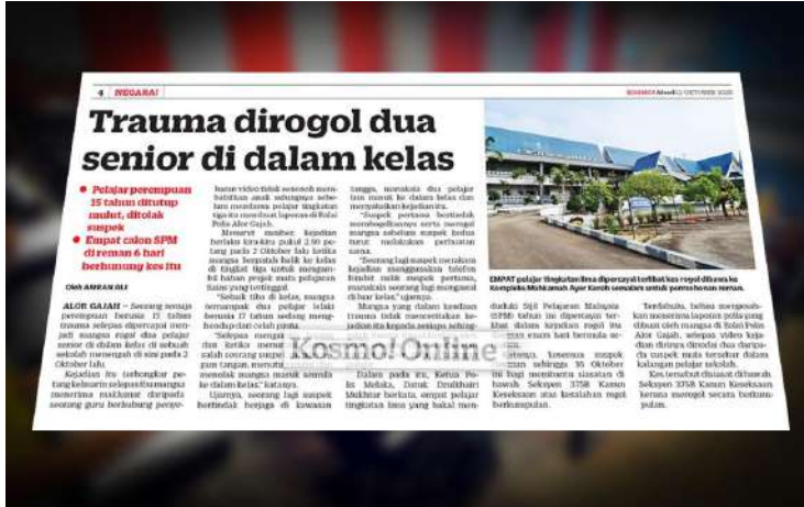
Kes-kes jenayah yang terjadi di sekolah memerlukan satu tindakan drastik dilakukan bagi menanganinya.